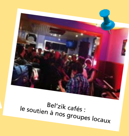
Bel'zik cafés : le soutien à nos groupes locaux