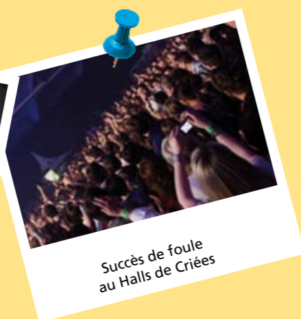
Succès de foule au Halls de Criées